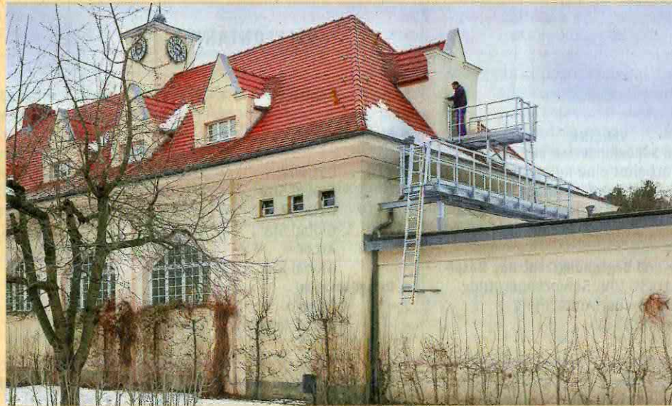
Schon von draußen fällt auf, dass sich an der Turnhalle etwas getan hat.

Sie wurde im Stil des Art déco erbaut, mit einer vollendeten Eleganz und dominanten dekorativen Elementen. Vor allem Theater und große Museen in den Metropolen der