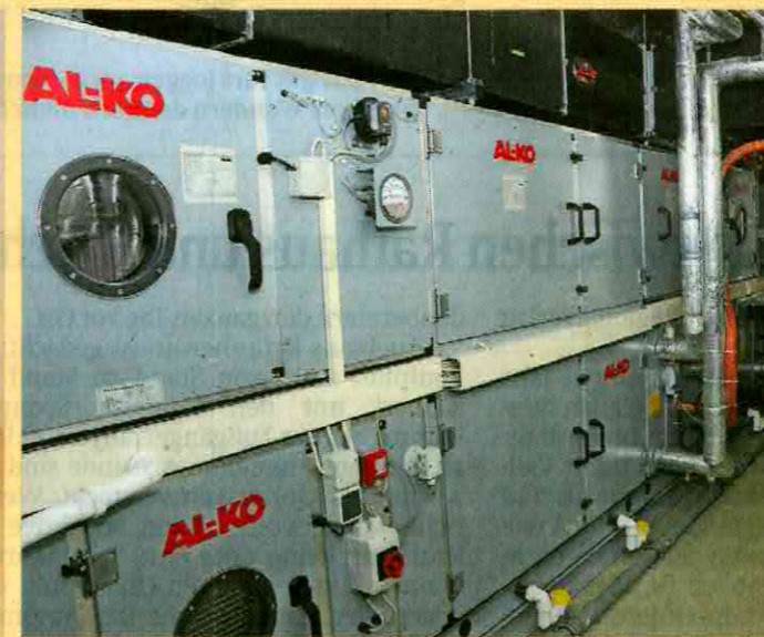
Lüftungs- und Heiztechnik

In die Verwirklichung dieses anspruchsvollen und zugleich