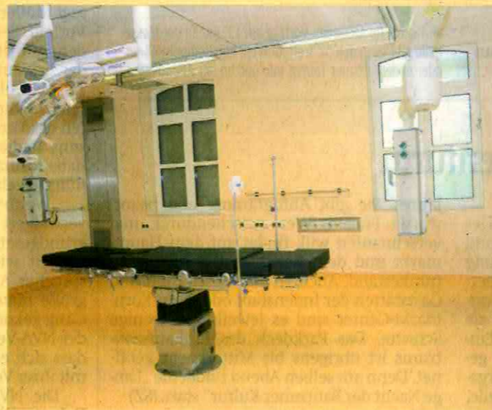
Neuer, heller OP-Saal

Während der Bauarbeiten wurde hinter dem Hauptgebäude ein OP-Modul als Interimslösung aufgebaut. Hier operierten seither die Ärzte und OP-Schwester auf dem von den Patienten gewohnten und zugleich erwarteten hohen medizinischen Niveau. Diese Interimslösung gehört nun ab Mitte Juni der Vergangenheit an. Ab diesem Zeitpunkt stehen die nach höchsten