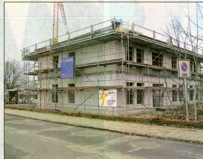
An der Bahnhofstraße in Niesky entsteht der Neubau der WOBAG. Im September 2015 soll Einzug sein.

Auch das Interesse der Nieskyer Bevölkerung am Baufortschritt ist offenbar nach wie vor groß. „Es kommen immer wieder Leute, die sich diesen Teil der Nieskyer Stadtentwicklung nicht entgehen lassen wollen.“