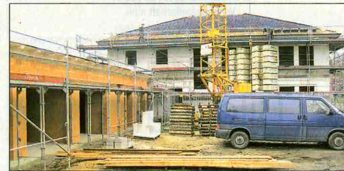
Der Rohbau für den neuen Firmensitz der WOBAG wird pünktlich zur Winterruhe fertig gestellt.

Sehr zufrieden ist der WOBAG-Geschäftsführer mit der Arbeit der planenden bzw. baubetreuenden Ingenieure Krause, Lehmann und Birn-