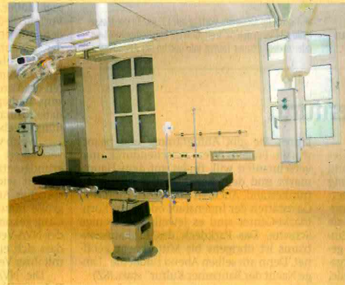
Neuer, heller OP-Saal

Während der Bauarbeiten wurde hinter dem Hauptgebäude ein OP-Modul als Interimslösung aufgebaut. Hier operierten seither die Ärzte und OP-Schwester auf dem von den Patienten gewohnten und zugleich erwarteten hohen medizinischen Niveau. Diese Interimslösung gehört nun ab Mitte Juni der Vergangenheit an. Ab diesem Zeitpunkt stehen die nach höchsten